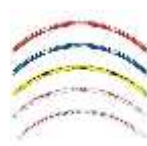
Conjunto de adhesivos para las llantas de 17"